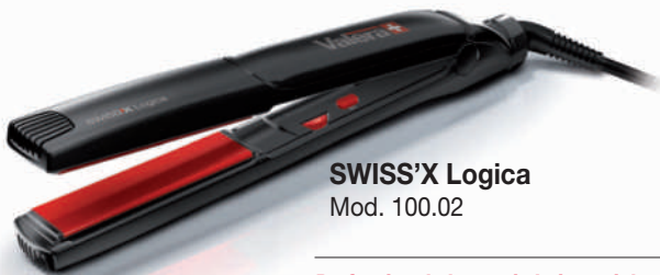
SWISS'X Logica Mod. 100.02