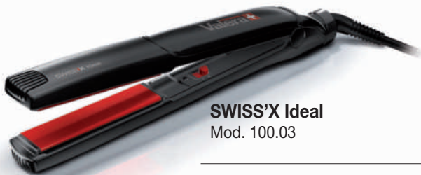
SWISS'X Ideal Mod. 100.03