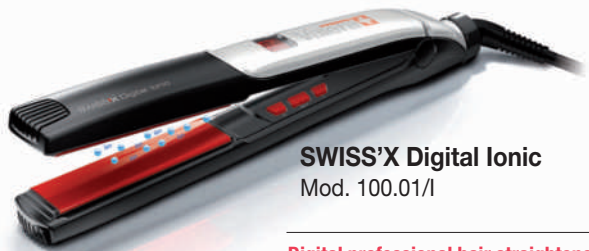
SWISS'X Digital Ionic Mod. 100.01/1